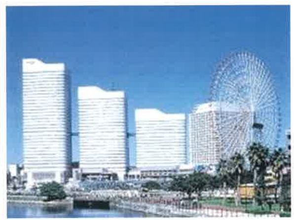
みなとみらい・桜木町地区の観光客数の推移