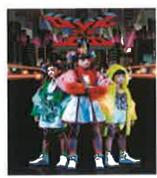
DEVIL NO ID