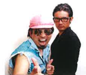
ポニーテールリボンズ